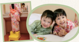
お子さまも安心してお泊まりいただけます。

飛騨高山の情緒を楽しみながらゆったり過ごす旅時間。部屋から眺めるは、古き良き日本の景色。高山の山々が緑を生い茂らせ、その麓を清流・宮川が流れ、いつ来ても変わらぬ景色にてお客様をお迎えさせていただきます。