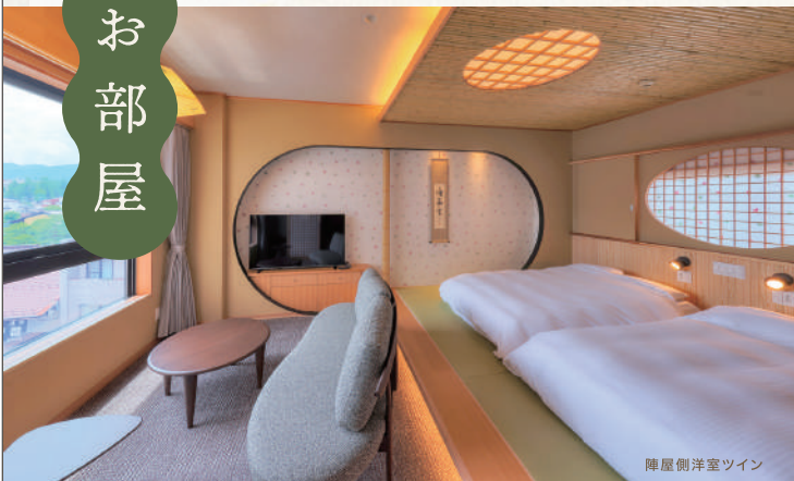
陣屋側洋室ツイン