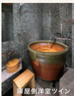
陣屋側洋室ツイン